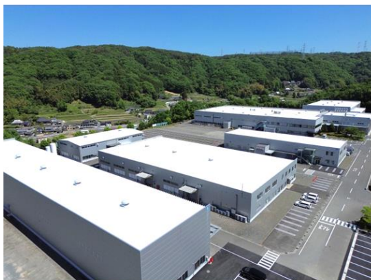
本社工場 遮熱塗装後の全景写真